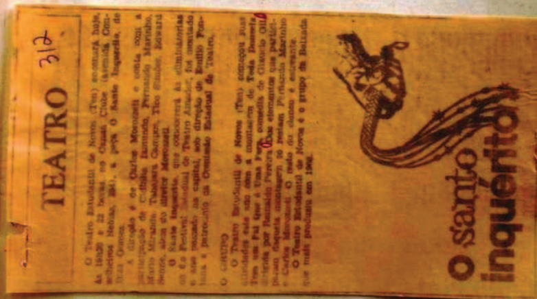
Documento 50-Z-081-13372. Data de arquivamento: 26/08/1968.