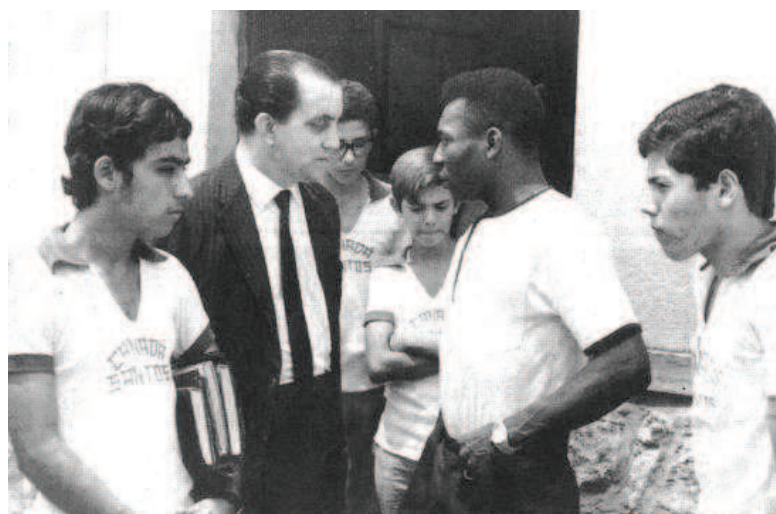
Figura 2. Alunos do Colégio Canadá, com o diretor Edésio Del Santoro, em visita ao atleta Edison Arantes do Nascimento (Pelé), no Santos Futebol Clube, em 1963.