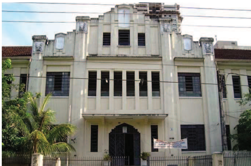
Figura 1. Fachada do Colégio Canadá.