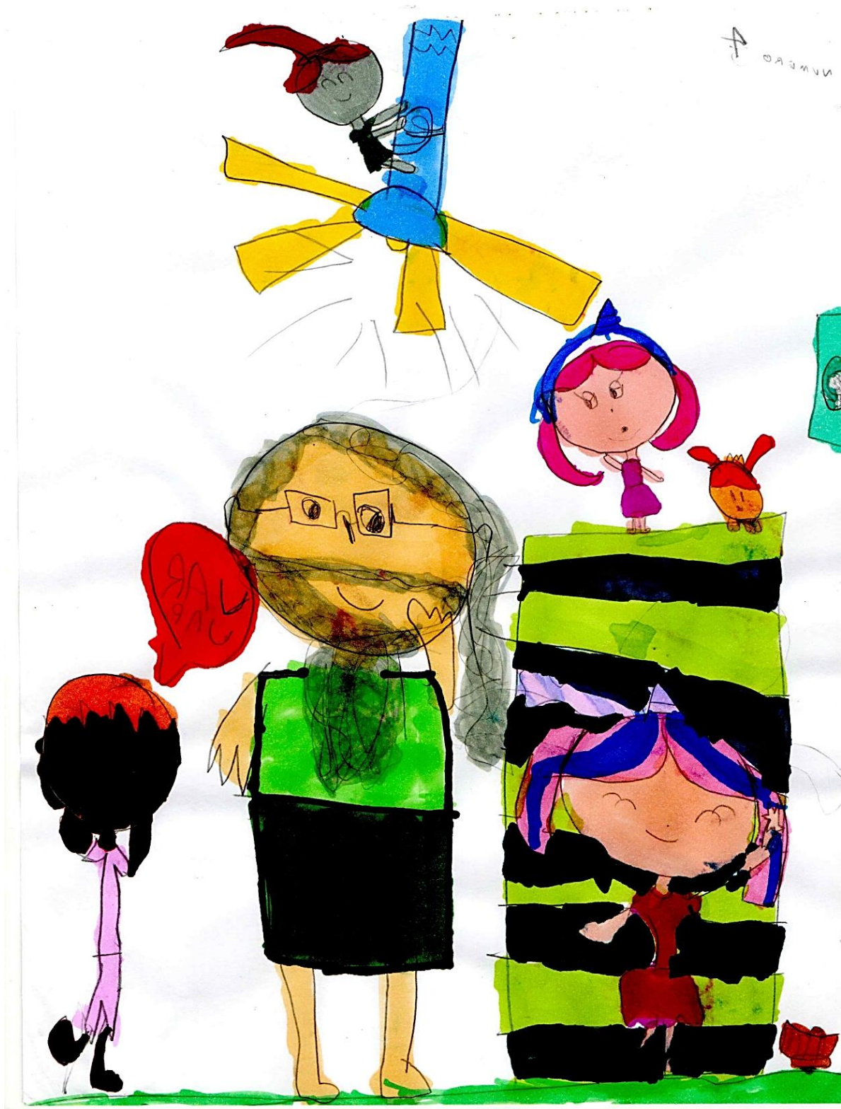
“Paulo Freire brincando de pega-pega”